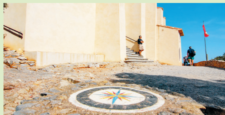
Voor de ingang van de kapel een wachtpost, binnen de Madonna die zeelieden beschermt

In dit extreme klimaat gedijt op de karstbodem een typisch mediterrane vegetatie: geurige kruiden en altijdgroene struiken, steeneiken, hulsteiken, aleppodennen en parasoldennen. Tussen kloven en rotspartijen hebben de boeren kleine stukjes in cultuur gebracht en olijven en druiven aangeplant. Rond de veertig wijnboeren produceren op dit buitengewone terroir wijnen van grote naam. Borden wijzen de weg naar de châteaux . Over hobbelige, avontuurlijke weggetjes kun je omhoogrijden naar