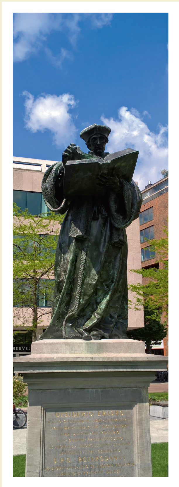
Standbeeld van Erasmus van Hendrick de Keyser Rotterdam.