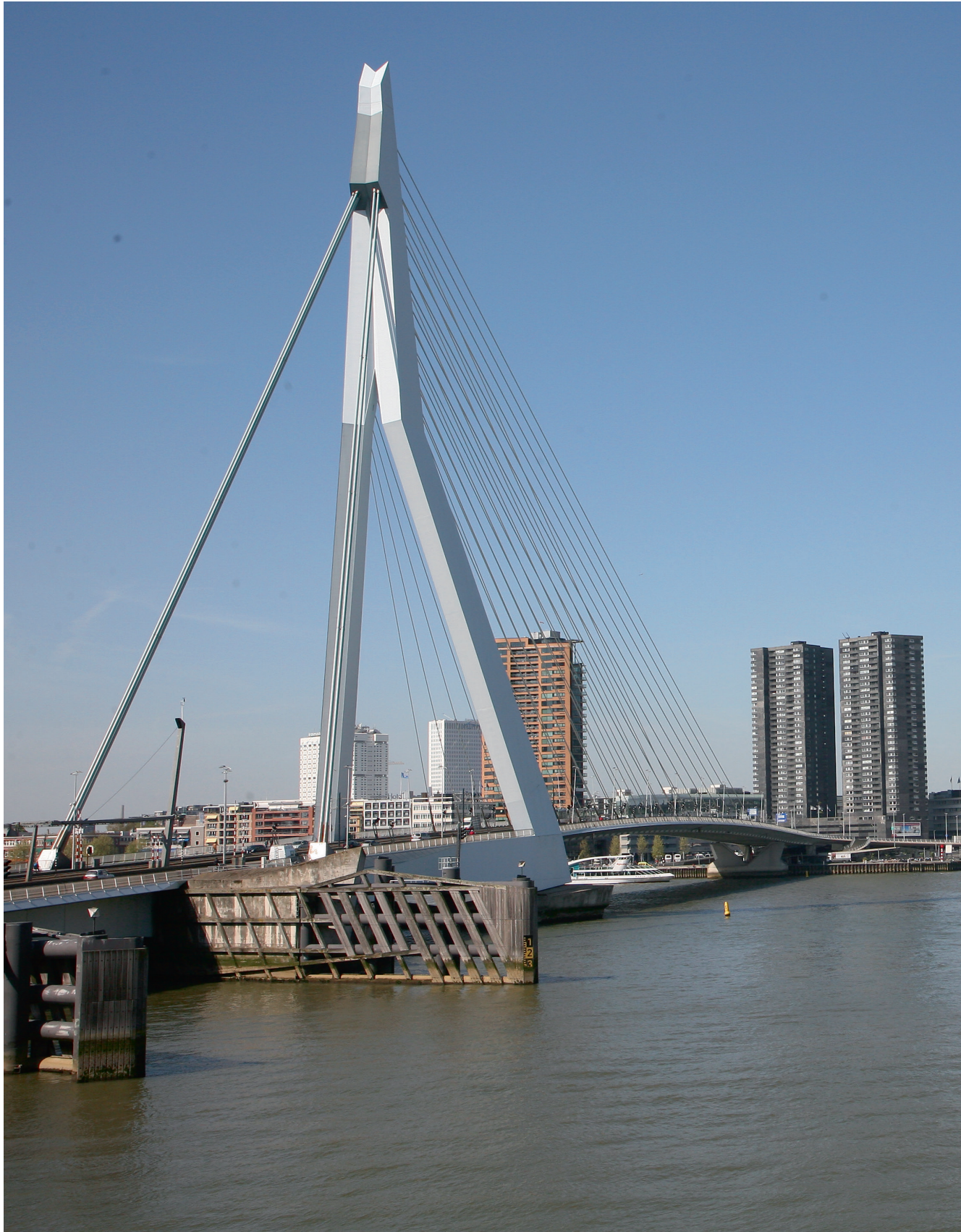
Erasmusbrug in Rotterdam. | Foto W. Bulach.