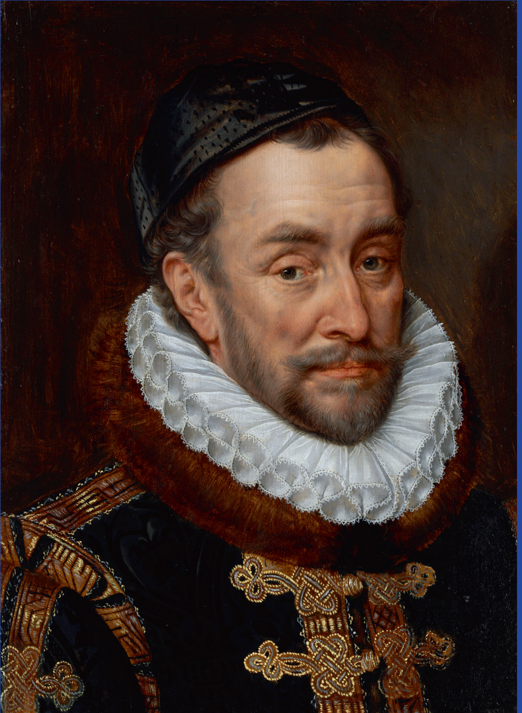
Portret van Willem van Oranje door Adriaen Thomasz. Key (ca. 1579).