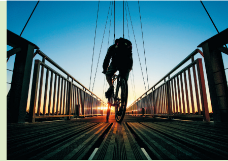
Het begin van een mooie dag.

Het vroegere station van Espiet 5 herbergt nu Restaurant de la Gare. Er slingeren helmen en zadelstasjes rond, kinderen klauteren uit aanhangers.