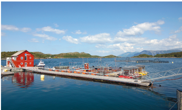
Het Norsk Havbruksenter in Tofte doet onderzoek naar het kweken van vis

Noorse vissers zijn vooral actief in de kustwateren en hun vangst wordt via lokale visafslagen op de markt gebracht, al zijn er natuurlijk veel internationale contacten. Een belangrijke tak is de kweek van vissen, met name zalmen, die grotendeels worden geëxporteerd. Ook kabeljauw wordt er gekweekt. De branche heeft de laatste jaren last van plagen als giftige algen die de gekweekte vissen aantasten en onverkooptbaar maken. ■