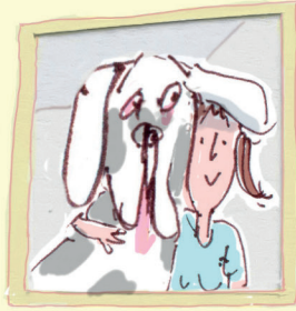
De lieve mevrouw met het hondje