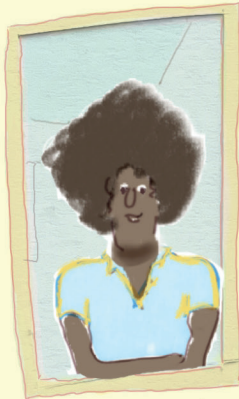
vader van Alfie