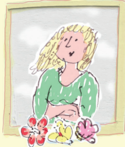
moeder van Alfiedie op wereldreis is