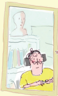
oma van Alfie