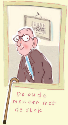
De oude meneer met de stok