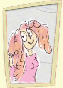
De mevrouw met het mooie haar