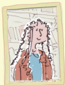
De aardige mevrouw