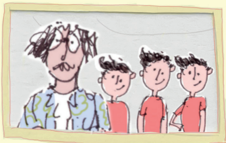
De vader van een drieling