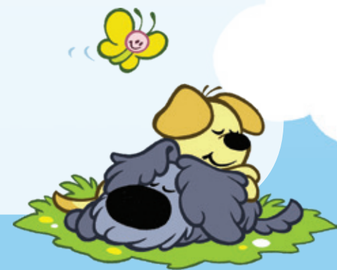
foto van mijn gezin