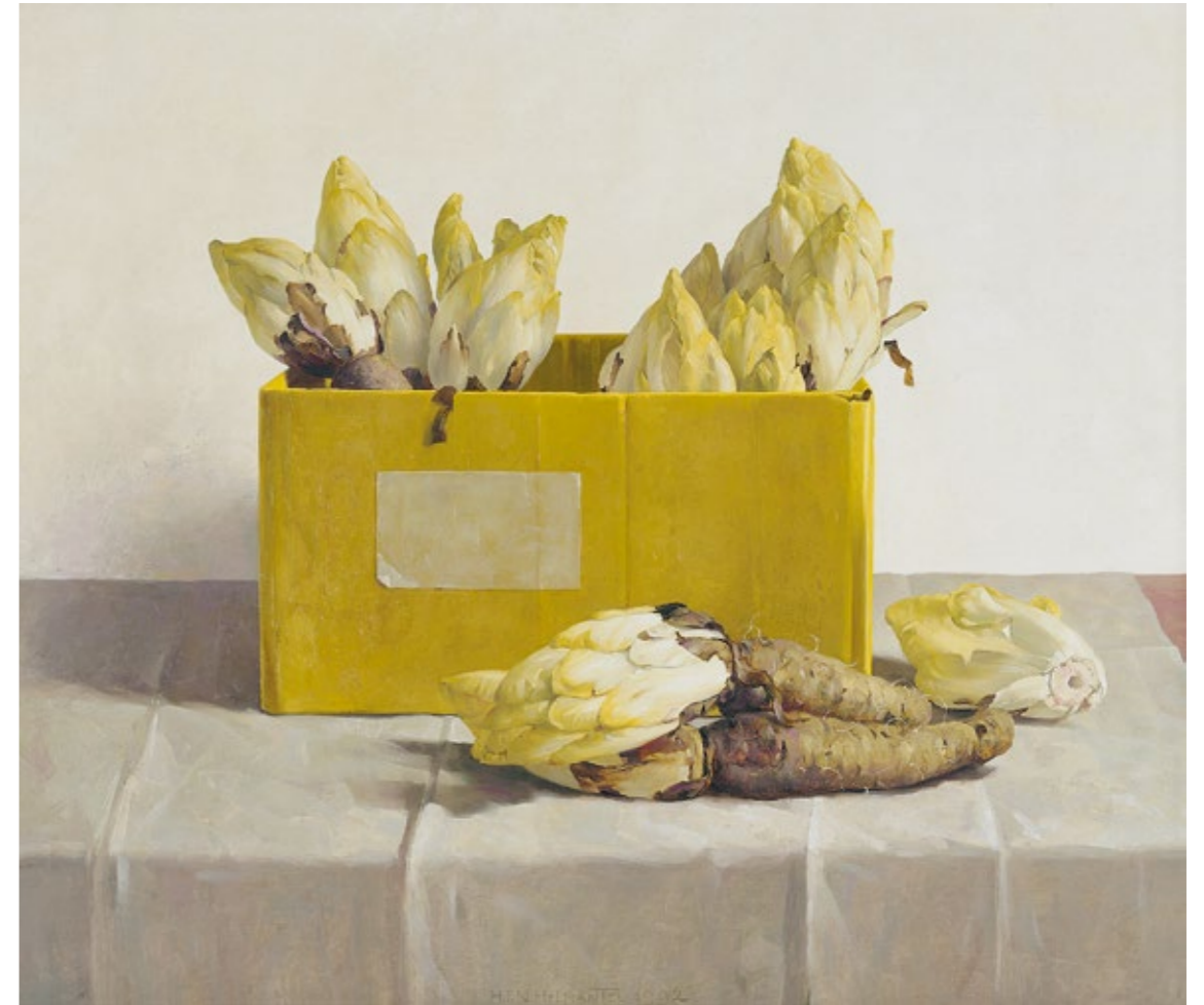
Witlof in gele doos, 72 x 85 cm 1992