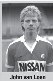
John van Loen